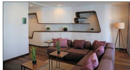
Das gemütliche Wohnzimmer steht Eltern und Geschwisterkinder ebenfalls als Rückzugsraum zur Verfügung.