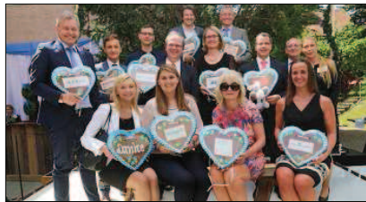
Nicht zuletzt hat die tatkräftige Unterstützung aus der Region das Projekt möglich gemacht.

Passau. Für viele Eltern ist es eine schlimme Vorstellung: Ihr Kind erkrankt schwer und muss für Wochen oder Monate in einer Klinik weit weg von zu Hause behandelt werden. Neben