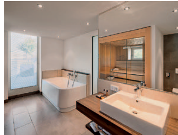
Auch außergewöhnliche Wünsche können erfüllt werden. Ein Studio bietet eine In-Room-Sauna.

Mit ihrer B+N Hotelbetriebs GmbH sind Bootsma und Neuhaus heute Mieter und