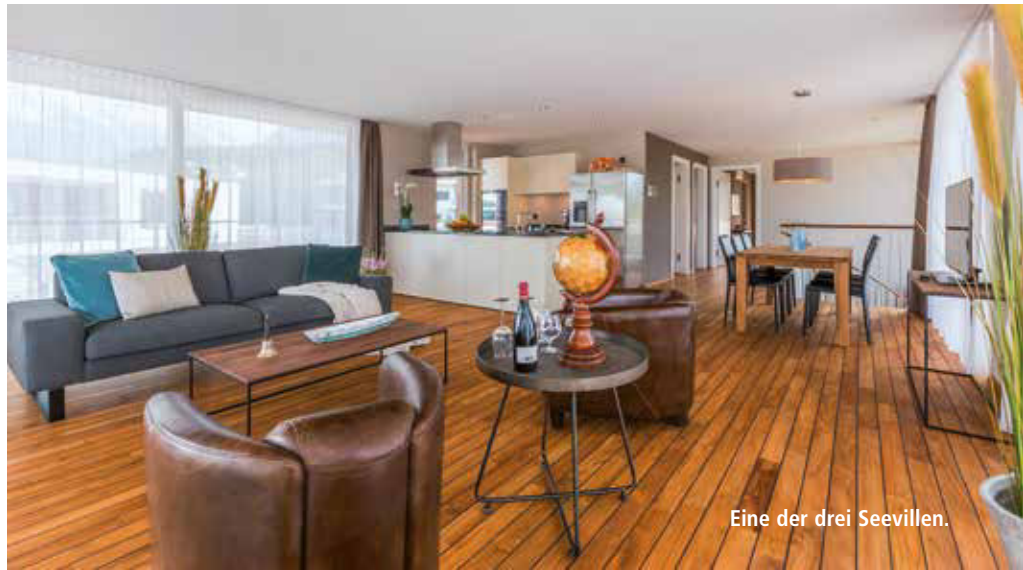
Eine der drei Seevillen.